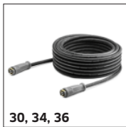
30, 34, 36